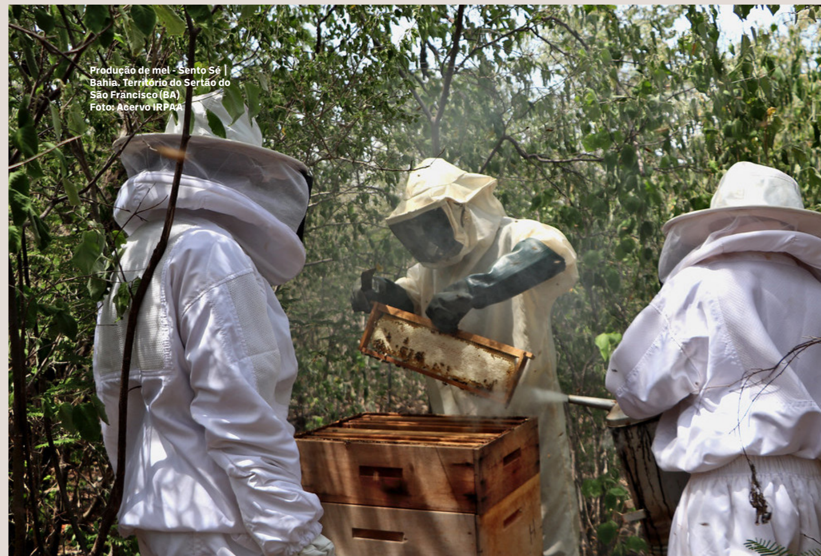
Produção de mel - Sento Sé | Bahia, Território do Sertão do São Francisco (BA)

Abordagens Há divergências sobre o entendimento de quais são as abordagens mais adequadas para a execução da ATER, incluindo tensões entre enfoques produtivos, multidimensionais, territorializados e digitais. Embora a atual gestão do MDA tenha reforçado a agroecologia como diretriz, os entrevistados avaliam que persistem as abordagens com foco produtivista e individualizado.