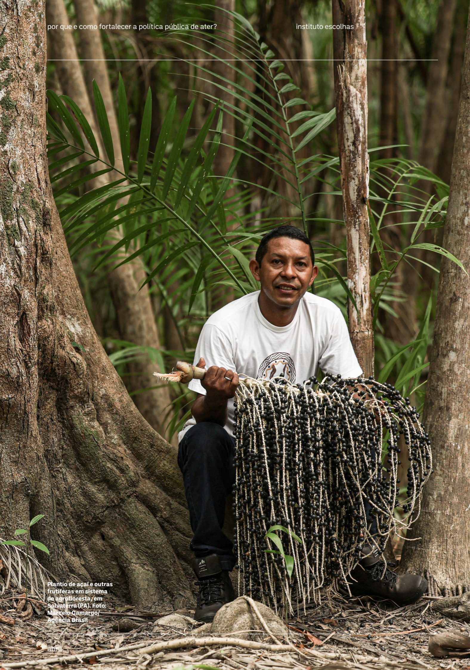
Plantio de açaí e outras frutíferas em sistema da agrofloresta, em Salvaterra (PA).