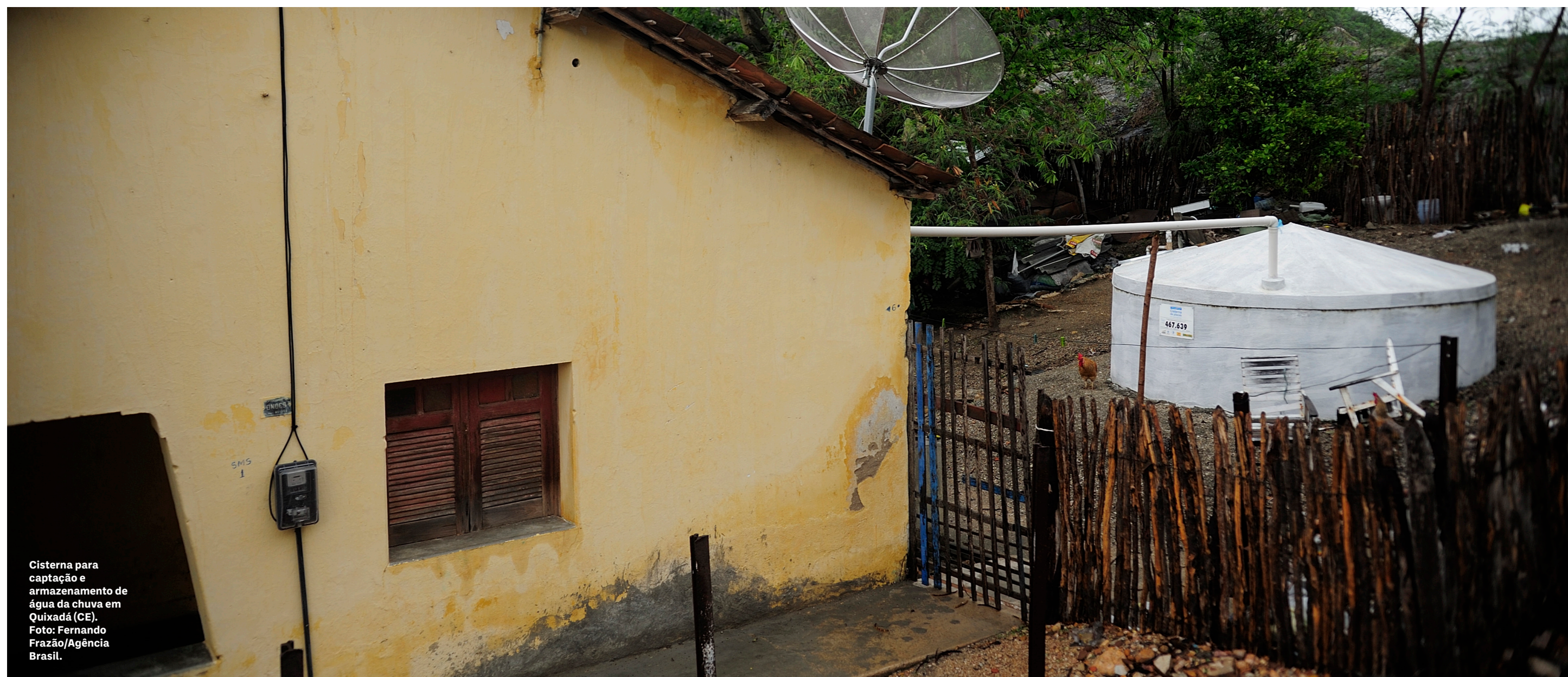
Cisterna para captação e armazenamento de água da chuva em Quixadá (CE).

a preocupação é de que essa centralização não venha acompanhada de pactuação interfederativa, corresponsabilização de estados e municípios, regras claras de cofinanciamento e mecanismos que reconheçam capacidades desiguais entre territórios.