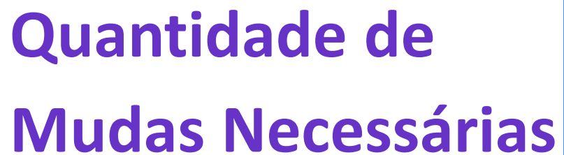
Tabela 6. Número de mudas para a recuperação da vegetação com Sistemas Agroflorestais nas APPs dos assentamentos rurais do Ceará.